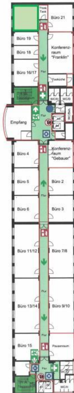
Grundriss Büroetage, Büro (s. Markierung)