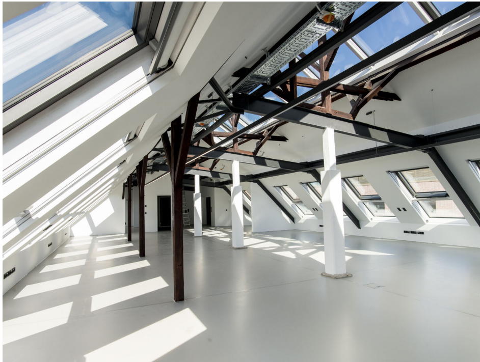
Innenansicht nach Sanierung