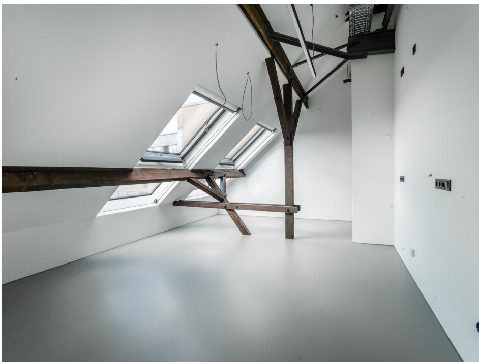
Innenansicht nach Sanierung